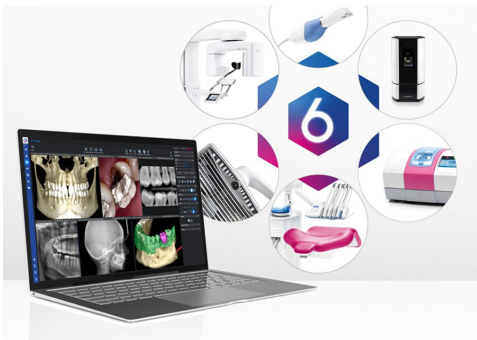
Die Romexis 6 Software ist der Mittelpunkt der Planmeca Produkt-Philosophie